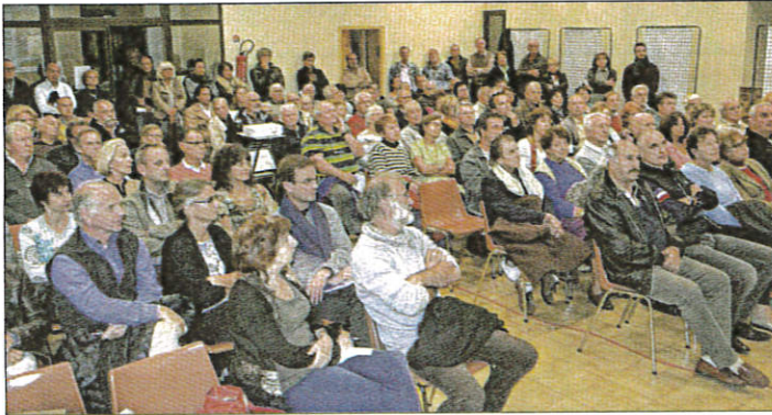
Une salle pleine avec des habitants debout et même dans le sas d'entrée, pour cette réunion fixant les grandes orientations d'urbanisme de la commune.

« Voilà ce que nous envisageons et que nous voulons partager avec vous. Nous vous proposons une présentation, vous pourrez ensuite regarder les panneaux en compagnie d'un élu. Ils seront aussi exposés en mairie. Nous souhaitons enfin que vous répondiez au questionnaire remis à tous les habitants afin de pouvoir tenir compte de vos remarques » insistait le premier magistrat.