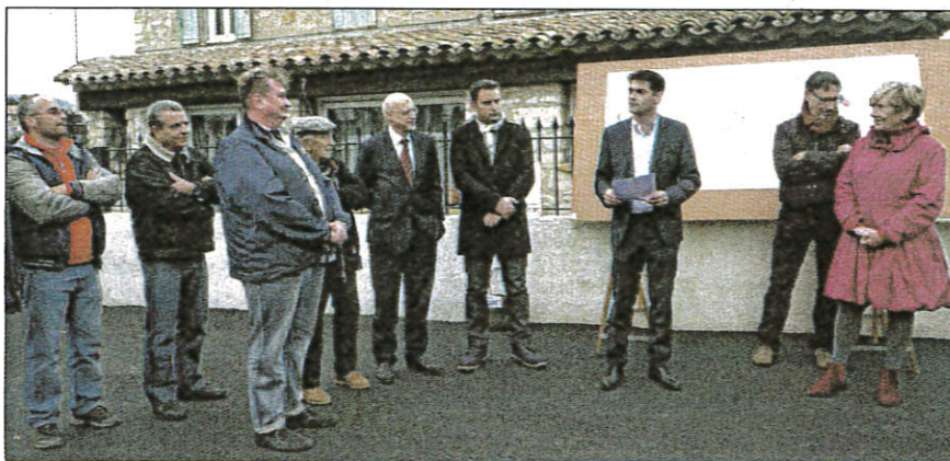
L.S. Les demandes des riverains de la route de Mouans-Sartoux ont été entendues.

La fin de ces travaux est prévue pour le 18 décembre.