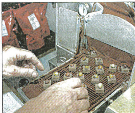
La préparation des chocolats.