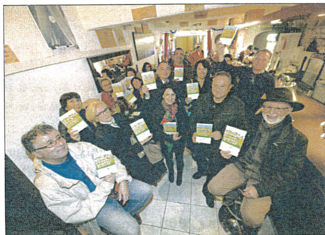
Le bar à vin Le Comptoir a accueilli l'association les passeurs de livres ainsi que les lauréats publiés sur le recueil Ecris, vins sur vingt.