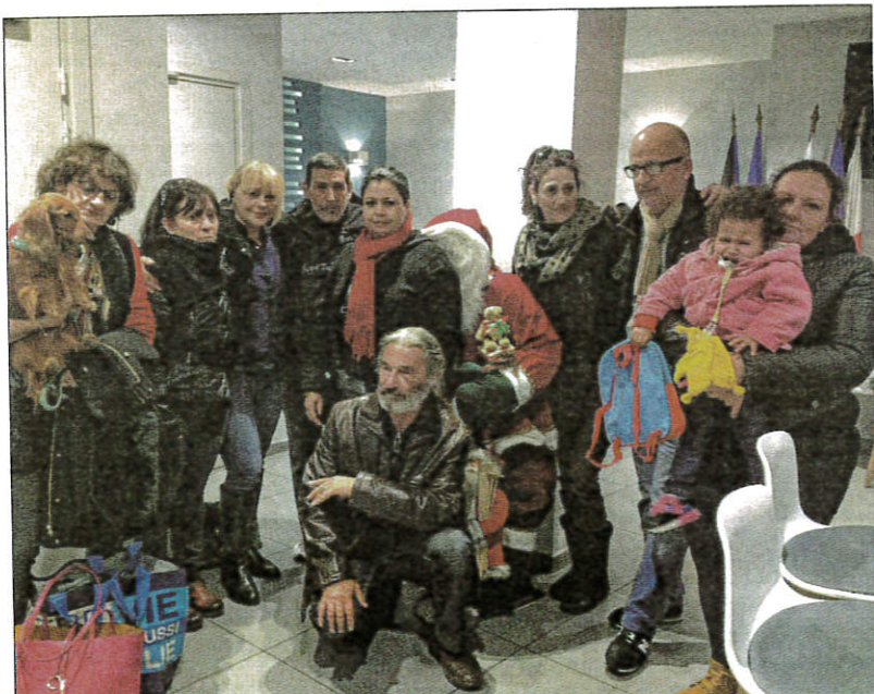
Une partie des sinistrés toujours logés à l'hôtel du Patti en attendant que des solutions soient trouvées.