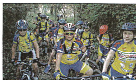
La jeunesse toujours aux avant-poste à l'U.S.P.