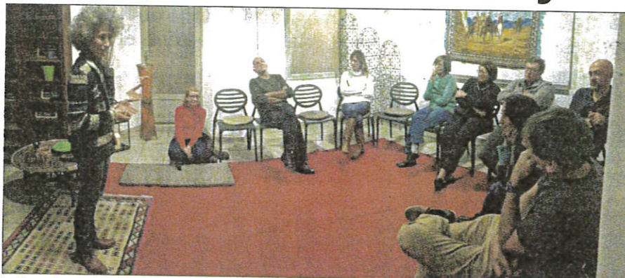
La Bouqala maghrébine a été présentée, hier soir, au centre social Harjès.