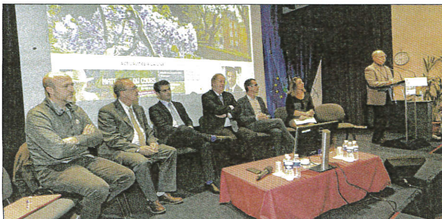
Le maire, les experts et techniciens ont exposé la situation, présenté le calendrier des travaux, les mesures de relogement et répondu aux questions de la salle.

Avec tout d'abord une certitude : ce sera long, compli-