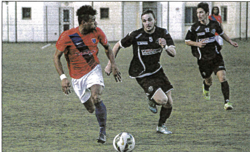
Les Grassois ont décroché leur 4 e match nul dimanche dans le Var face Fréjus/St-Raphaël.