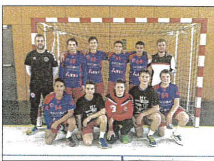
Les moins de 16 ans 3 qui a atomisé l'équipe de La Colle.

Avec une grosse envie, les bleu et rouge reviennent à un but : 19-20, mais un dernier but visiteur dans les dernières secondes anéantit les