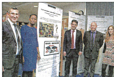
A l'ouverture de cette exposition du conseil départemental sur la route Napoléon.

Dans sa première partie, l'exposition place le visiteur dans le contexte de l'époque : le département comptait en 1803, 91 000 habi-