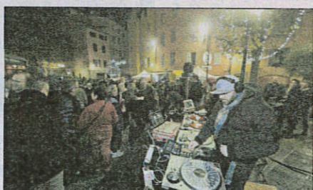
Deux Dj ont animé la soirée organisée place de l'Evêché.