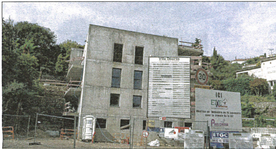
L'un des rares chantiers de construction de logements sociaux de ces dernières années à Grasse.

Pour éviter cela, la Ville – ainsi d'ailleurs que l'agglomération – s'est engagée dans une démarche de partenariat avec l'État par le biais de la signature d'un contrat de mixité sociale. La commune s'y engage à mener une politique active et volontariste de produc-