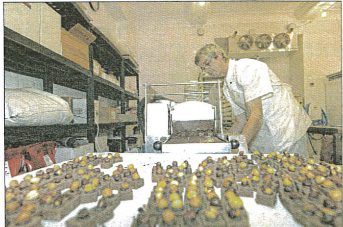
Le chef-chocolatier travaille à l'enrobeuse à la fabrication des chocolats.