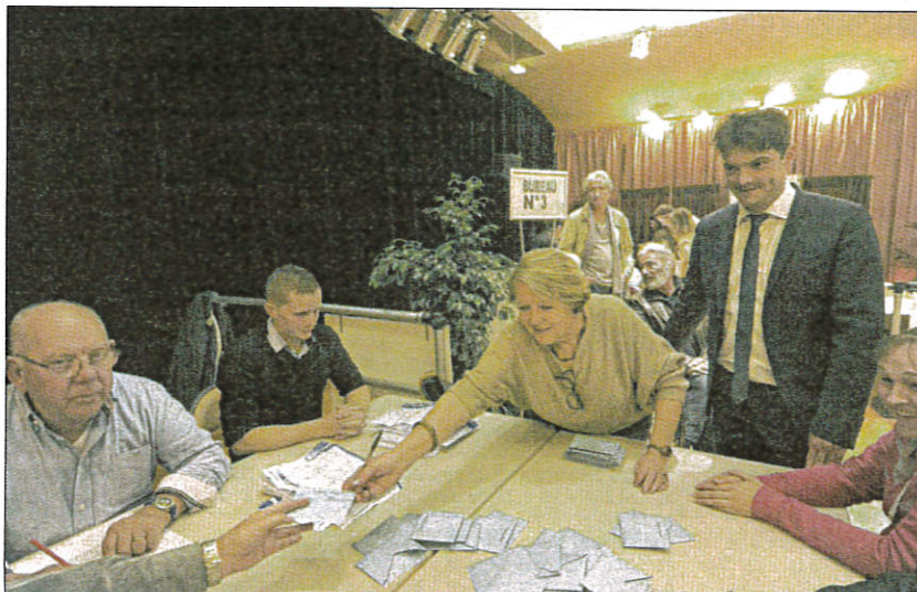
Le maire avait retrouvé le sourire dimanche soir, à l'issue des opérations de dépouillement confirmant la victoire de Christian Estrosi.

De tous les partis d'ailleurs. Car le FN, qui avait engrangé 5951 suf-