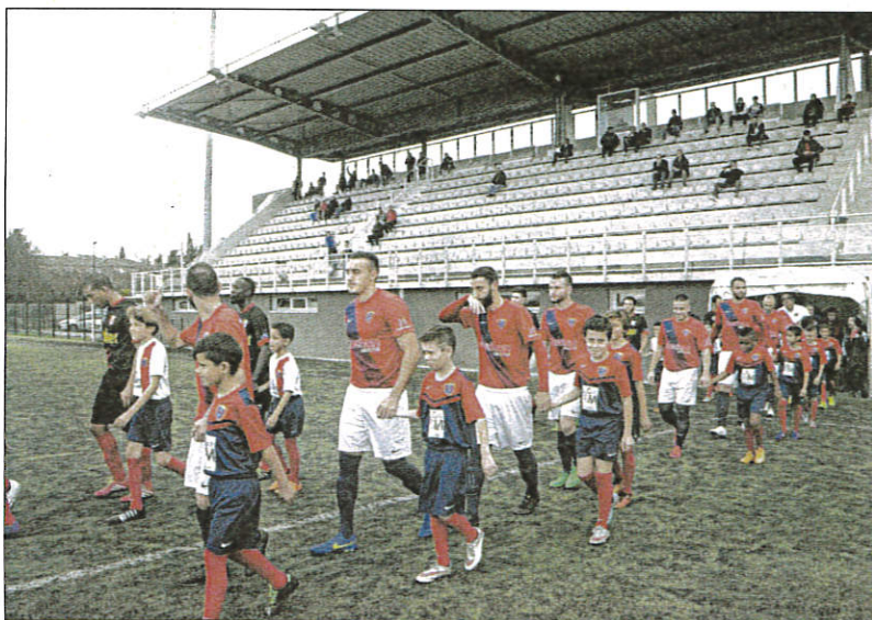
Les « Rouge et Bleu » poursuivent leur belle série d'invincibilité avec un 8e match de rang sans défaite. Mieux ils ont décroché dimanche un 4 e succès face à la Penne 2-1.

Solide sur ses bases arrières, le Racing est la meilleure défense du