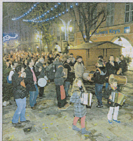
Le conservatoire de Grasse a animé la marche aux flambeaux.