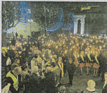
La place du petit Puy était le départ de la marche aux flambeaux.