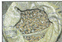
Les fèves arrivent de sierra Leone, Madagascar, Ganha, Pérou, Bali, etc. par sacs de 80 kg.