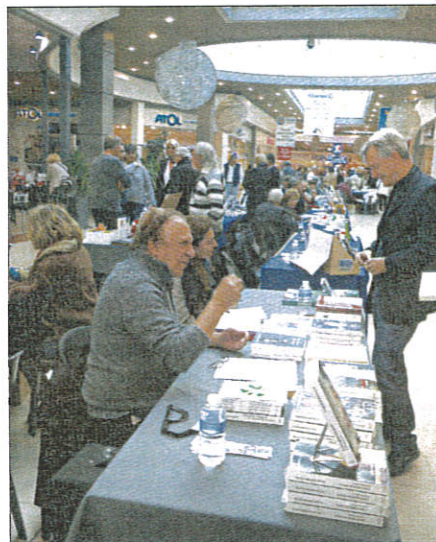
Le festival a débuté hier et s'achèvera demain soir, à 17 h.

Galerie marchande du centre E. Leclerc, Samedi, de 10 h à 18 h et dimanche de 10 h à 17 h.