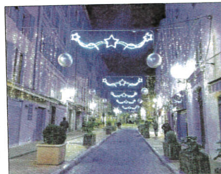
Le sapin du square du Clavecin a lancé l'illumination de tout le centre-ville. Les petites étoiles de la traverse et de la rue des Sœurs pour inciter les Grasseois à s'aventurer dans les ruelles et puis les nouveaux motifs de la place aux Aires.

convictions nécessaires pour gérer la Région ». Autour de lui étaient rassemblés de nombreux maires et élus du Pays de Grasse, dont Jean-Marc Délia et David Varrone, colistiers de Christian Estrosi.