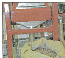
Des plaques entières de toutes sortes de parfum, ici des mendiants, sont ensuite cassées au maillet.