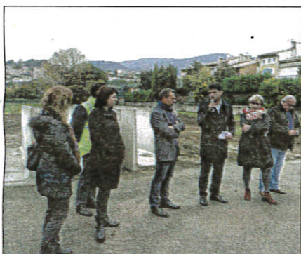
Les travaux réalisés dans le vallon du chemin des Alouettes, qui a été reprofilé et canalisé, ont été réceptionnés hier.