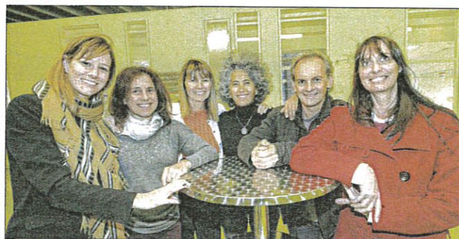
Littérature, conte, illustration, autant de nouveaux projets proposés aux jeunes.

À ce titre, Audrey Garnier, illustratrice, intervient pendant les temps scolaires dans le haut pays. Son fil conducteur : jardin et paysage. Elle propose aux jeunes de créer un livre dans